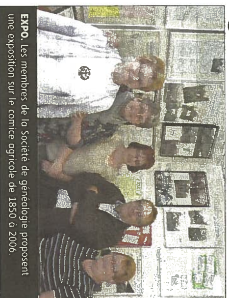
EXPO. Les membres de la Société de généalogie proposent une exposition sur le comice agricole de 1850 à 2006.

Au point de vue "retour d'émotions", le comice fut en tout temps très proche de la réalité comme on peut le lire dans un extrait du journal Le Patriote . Il